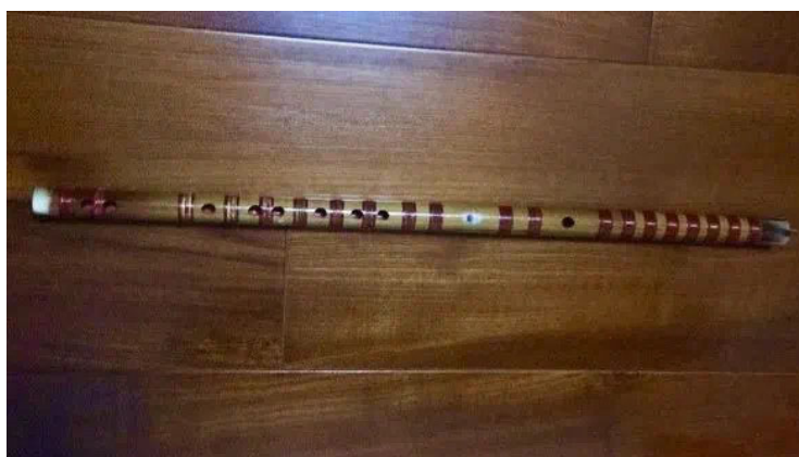
к у д и

издухване. Принципът на звукоизвличане на бамбуковата флейта е чрез вибрациите на въздуха вътре в бамбуковата тръба. Флейта включва куди и бангди, разликата между тях е, че куди е широка и дълга, докато бангди е тънка и къса. Тези флейти са постоянна част от китайските народни инструменти.