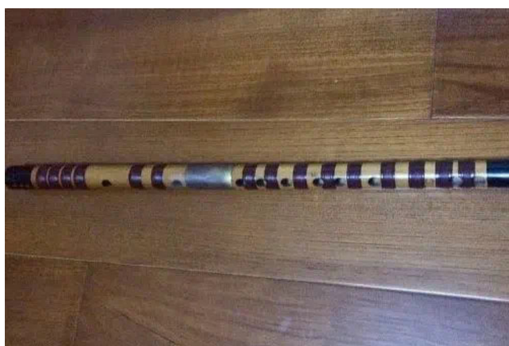
б а н г д и

Сяо , който може да бъде проследен до 5-ти век пр. н. е., се използва най-вече в дворцовата жертвена музика и в банкетната