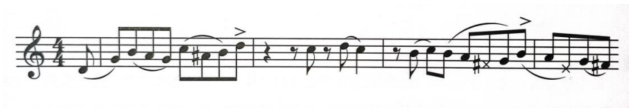
Фиг. 2 “Anthropology” – Charlie Parker

В горния пример е представена същата фраза, но с отбелязване на свързаността между нотите, което променя звучността на самата фраза. Този способ се усвоява след упорито слушане, изучаване и подражаване на големите саксофонисти като Лестър Йънг, Чарли Паркър, Кенънбол Адърли, Сони Ролинс.