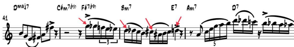
Фиг.12 Charlie Parker – „Confirmation”

В някои музикални фрази с шестнайсетини ноти, поради по-голямата бързина на изпълнение, доста саксофонисти вместо да изпълняват всички тонове стакато, избирателно изсвирват стакато само някои, които би трябвало да бъдат акцентирани. Например, в долната диаграма тоновете от второ до четвърто време от втори такт обикновено се изпълняват предимно легато, а ключовата нота, т.е. първата нота от такта се изсвирва стакато или с акцент.