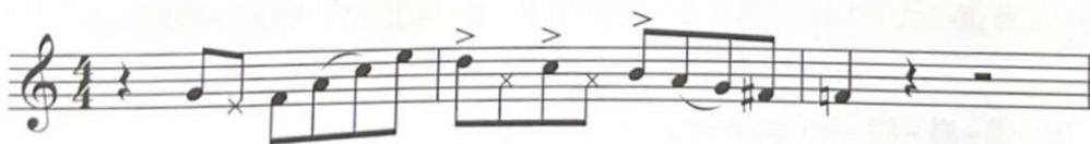
Фиг.8 (реално изпълнение)

В своята интерпретация на „Confirmation“ Декстър Гордън използва ghosting ноти на първо и второ време от трети такт, както и на второ време от четвъртия такт на фразата.