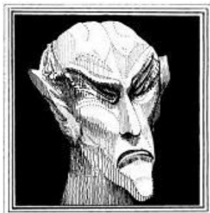
(Ариман според оригиналния модел от 10 см. височина)

във волята и системата веществообмяна-крайници. Те са духовни същества, които искат да възбудят интерес в човека за всичко, което например е външно механично. Те желаят да унищожат всичко, което Земята си е донесла от древната Луна, да изчезне животинският свят, да изчезне физическият човешки свят, също растителният, а от минералния свят да останат само физическите закони, но хората да бъдат взети от Земята и да образуват нов Сатурн от машини, нов свят от машини.... 203.259